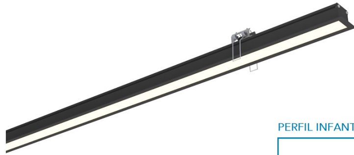
PERFIL INFANTI MINI II